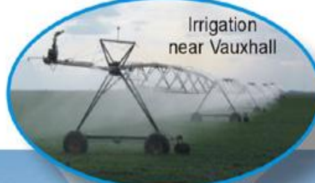
Irrigation near Vauxhall