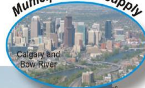
Calgary and Bow River