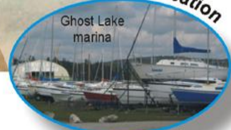
Ghost Lake marina