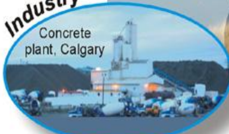
Concrete plant, Calgary